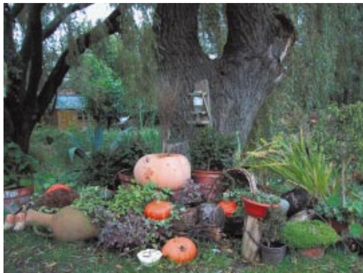
Tuin van Rommel

Om iedere vrijwilligers en met name degenen die niet altijd eenvoudig inzetbaar zijn, toch het gevoel te geven dat ze een belangrijke bijdrage leveren, is in de praktijk meer nodig dan een strakke weekindeling. Gedrevenheid, begrip en geduld zijn cruciale sleutelbegrippen. Mensen graag zien terugkomen en opbloeien is dan ook de beloning voor de vaste medewerkers. Kuijs: “Het is heel erg leuk dat wij dit kunnen realiseren met de middelen die we hebben.” In dit gehele proces om er samen wat van te maken mag iedereen meedenken. De betrokkenheid van veel Castricumers bij hún Tuin van Kapitein Rommel uit zich op allerlei wijzen. Sommigen komen met planten aanzetten. Anderen