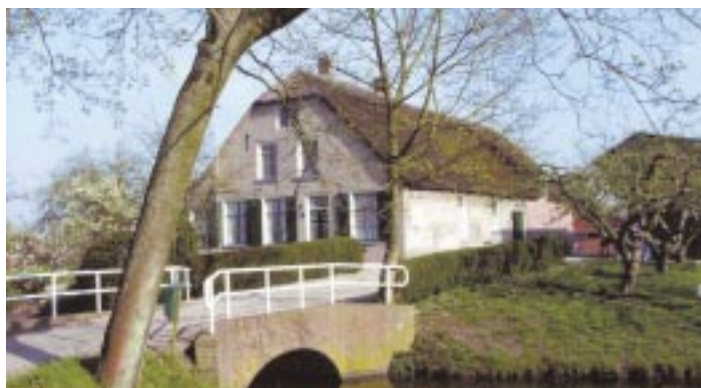
Boerderij & erf

Dit leidt veelal tot overeenstemming, dikwijls zijn eigenaren blij met deze gratis 'bemoeizorg'. Echter, lang niet altijd komt het tot overeenstemming over hoofdzaken. Waar nodig inventariseert de Stichting dan wettelijke interventiemogelijkheden en waar nuttig bindt zij dan de strijd aan. Dit betekent dat gemeenten geattendeerd worden op overtredingen van bestemmingsplannen, of gevraagd worden om geen bouwvergunning af te geven etc.