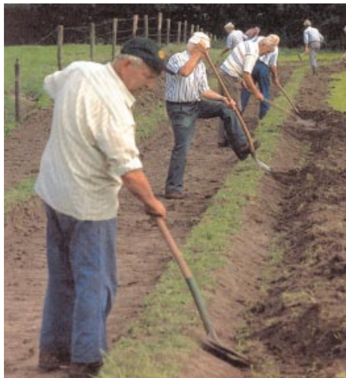
Met vereende krachten

Hier werden goede afspraken over gemaakt. Tijdstip, wie het doen, met welk materieel en onderwiens leiding etc. Soms werd in de onderhandelingen aangeboden sloten op te schonen, of nieuw te graven, afrasteringen te herstellen, houtwallen te snoeien, drainage aan de weilanden te verbeteren of lage stukken landbouwgrond te verhogen met