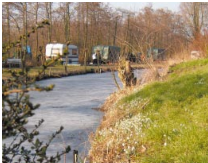
Kampeerterein De Hoogkamer

Het Nivon geeft het ledenblad de Toorts uit en heeft folders over de verschillende activiteiten.