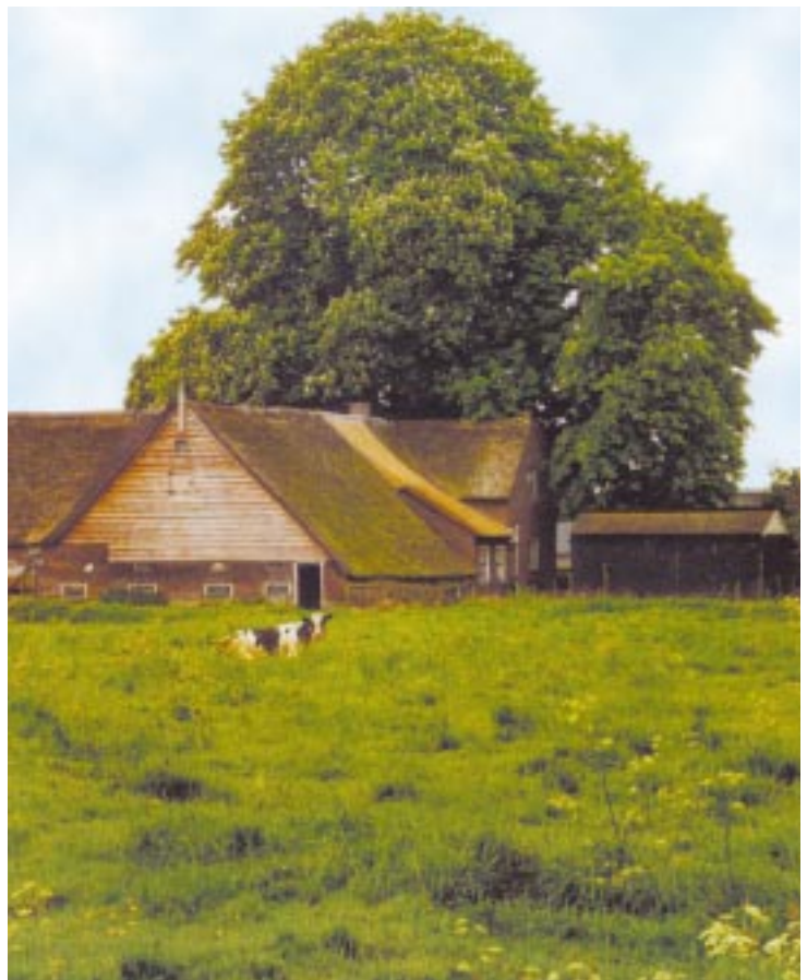
Boerderij & erf & koe

De grootste kunst voor de Stichting is, om toegang tot het afwegings- en besluitvormingsproces van de (nieuwe) eigenaar te krijgen. Meer nog: om er op tijd bij te zijn. Het mooiste is natuurlijk wanneer de eigenaar de Stichting uitnodigt om te komen praten. Vaker gebeurt het dat de Stichting een verandering of verkoop via-via hoort, soms pas als er een bouwvergunning is aangevraagd. In de praktijk blijkt dan, dat als eigenaren eenmaal "in fase drie zitten van hun plan, zij moeilijk nog te bewegen zijn fase vier en vijf te wijzigen, laat staan weer van voren af aan te beginnen". Daarom, hoe vroeger het advies verstrekt kan worden, hoe meer opties op tafel kunnen komen. Soms is het hierbij zaak om de plaatselijke aan- nemer voor te zijn, deze man kijkt beroepshalve